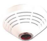
Suitsu- ja temperatuuriandur